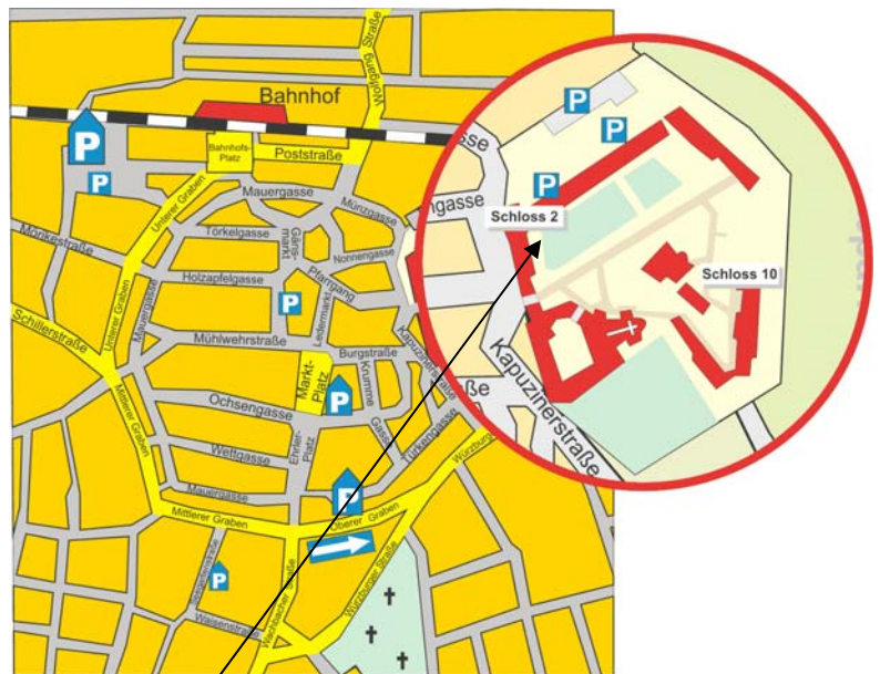
Stadtplan - Bad Mergentheim